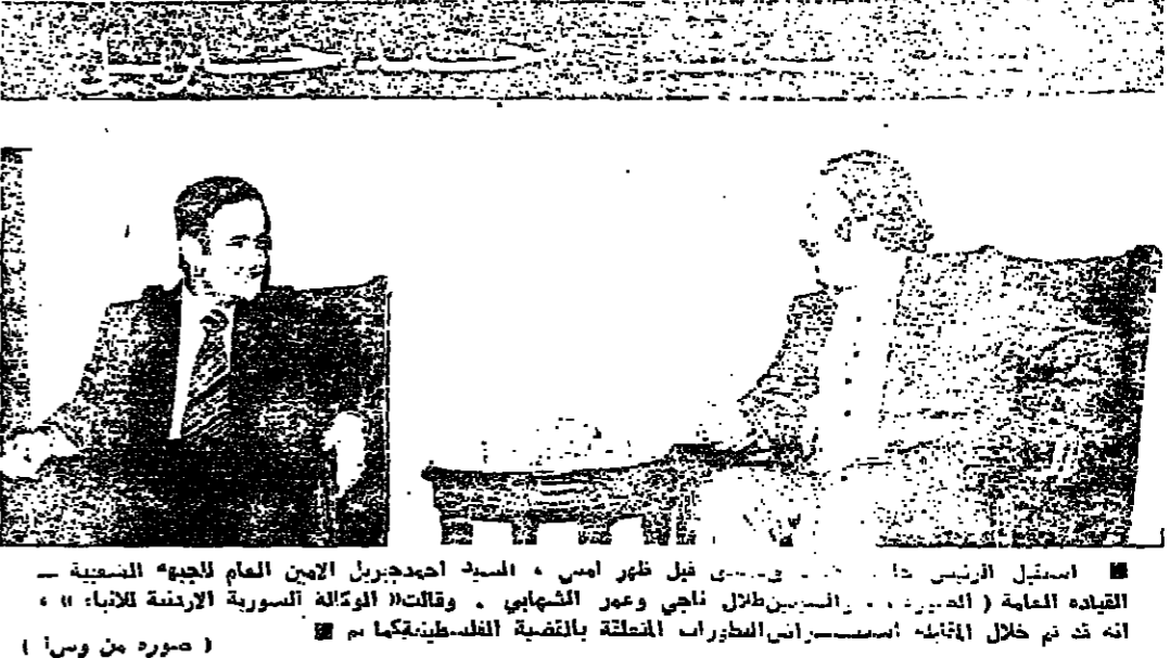
استقبل الرئيس حافظ الأسد في دمشق امس ، السيد احمد جبريل الابن العام للجبهة الشعبية للقيادة العامة (الحمورية) . والسيناتور ناجي وغير الشاهي . وقالت «الوكالة الدولية للاخبار» انهم قد تم خلال ايامه استعراض الطائرات المقاتلة الفلسطينية بقمها .

فكر مسؤولون في منظمة البلدان المصدرة للبترول (اوبك) امس ، ان وزراء مالية الدول المتسلطت عشرة الأعضاء ، منظمة ، سيهتمون في حينه في الرابع من اب المقبل فسيؤمّنهم النصف السنوي . وسيشرف وزراء المالية على توزيع خصصات الدول الثمانية من صندوق خاص رأسماله ١٦٠ مليون دولار كانت قد انشائه منظمة « اوبك » في العام الماضي . ولكن المسؤولون ان المصنوع الخاص سيكون موضوع البحث الرئيسي في هذا الاجتماع ، بعد اجتماعهم الاخير في شباط الماضي . كما سيبحث الوزراء في امور مالية اخرى متعلقة باعمال منظمة اوبك . وكانت حكومات منظمة اوبك قد تكديت في الاسابيع الاخيرة ، خسائر جسيمة بسبب انخفاض قيمة الدولار الأمريكي الذي يستعمل لخصومات اسعار النفط . ولكن مسؤولون انه ليست تلكاية خطط لاحياء مشروع المنظمة للتداول بعملة اخرى .